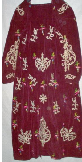
Entarinin Ön Ve Arka Görünümü