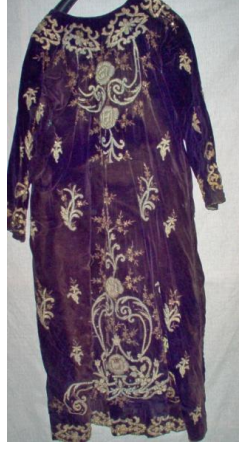
Entarinin Ön ve Arka Görünümü