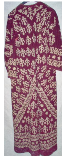
Entarinin Ön ve Arka Görünümü