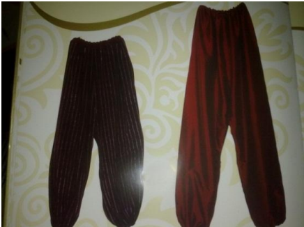
Şalvar Ön Ve Arka Görünümü