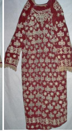
Entarinin Ön ve Arka Görünümü