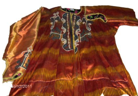
Entari Ön Görünümü