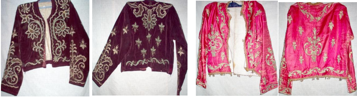
Cepken Ön Ve Arka Görünümü